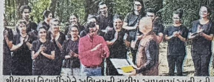
શ્રીલંકામાં વિદ્યાર્થીઓને અભિનયની તાલીમ આપવામાં આવી હતી

એમ.એસ.યુનિવર્સિટીની પરફોર્મિંગ આર્ટસ ફેકલ્ટીના નાટ્ય વિભાગના અધ્યાપક શ્રીલંકામાં વિદ્યાર્થીઓને રિસોર્સર્સ પર્સન તરીકે અભિનયની તાલીમ આપી છે. શ્રીલંકાના લોકો તેની સાથે જોડાઈ શકે તે માટે સ્થાનિક સિંહાલી ભાષામાં શ્રીપલ્લી કેમ્પસમાં નાટક રજૂ કર્યું હતું.